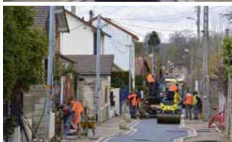
Enfouissement des réseaux aériens :