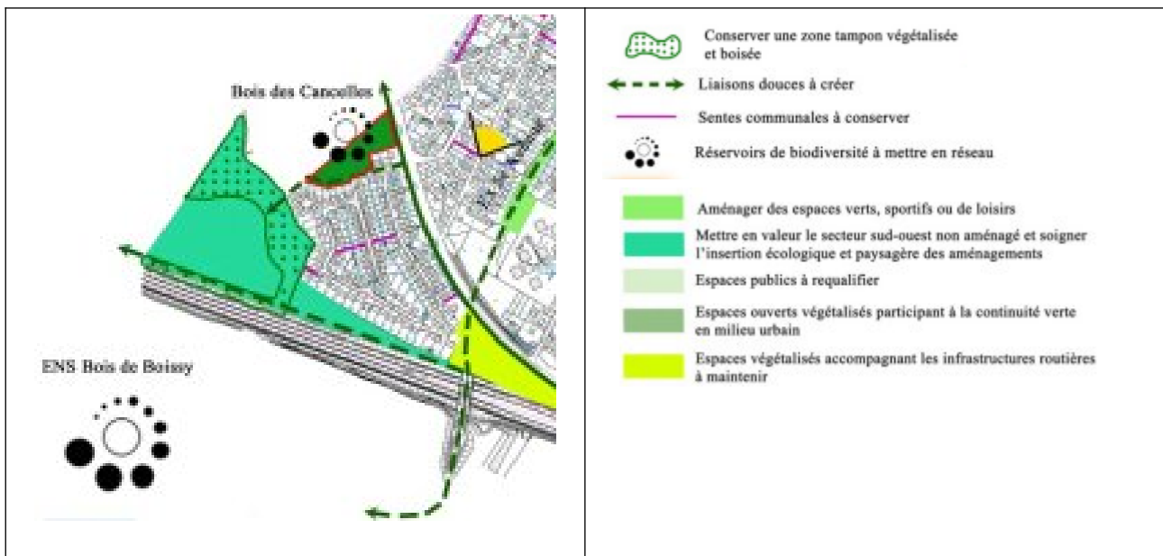
Illustration 4 : Extrait du projet d'OAP « La trame verte saint-loupienne »