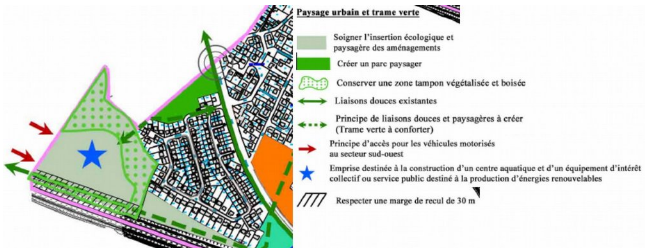
Illustration 5 : Extrait du projet d'OAP « Axe traversant est-ouest boulevard André Brémont »