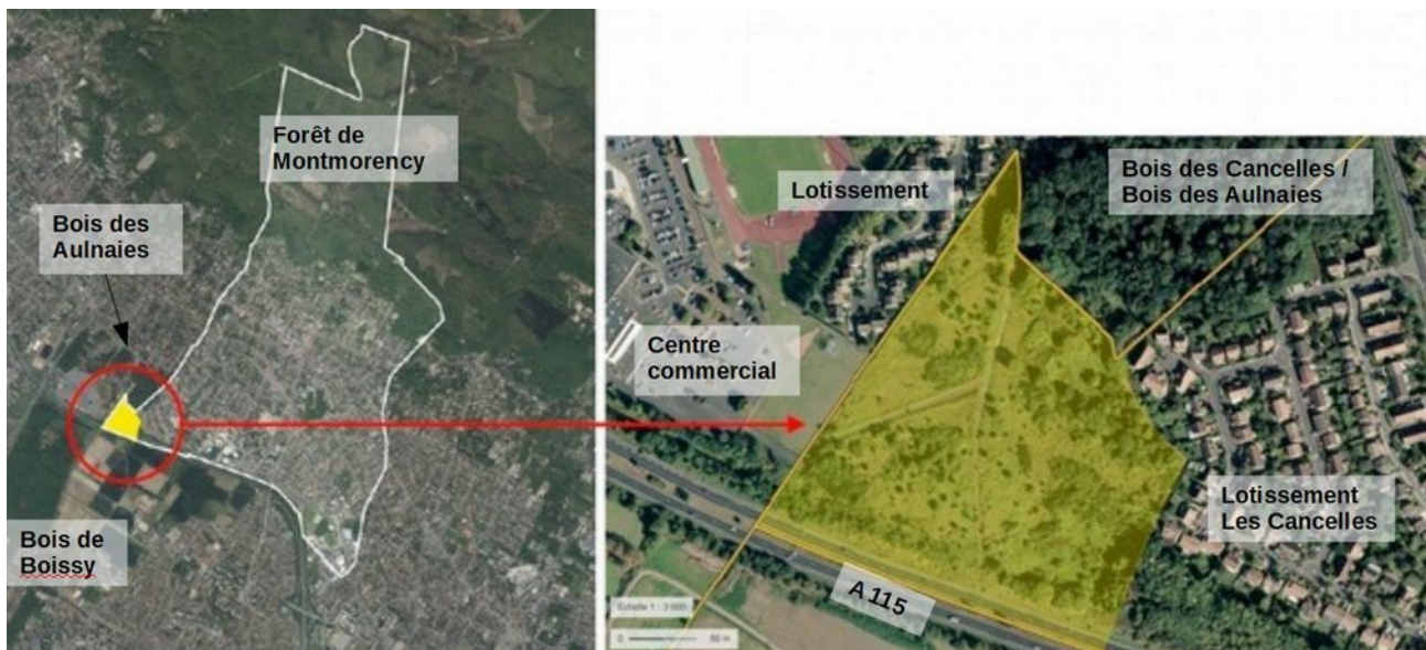
Illustration 2 : Localisation du site objet de la modification et détail de ses abords

Le secteur du Bois d'Aguère est classé en zone à urbaniser (zone AU1) dans le PLU en vigueur approuvé le 28 mars 2017