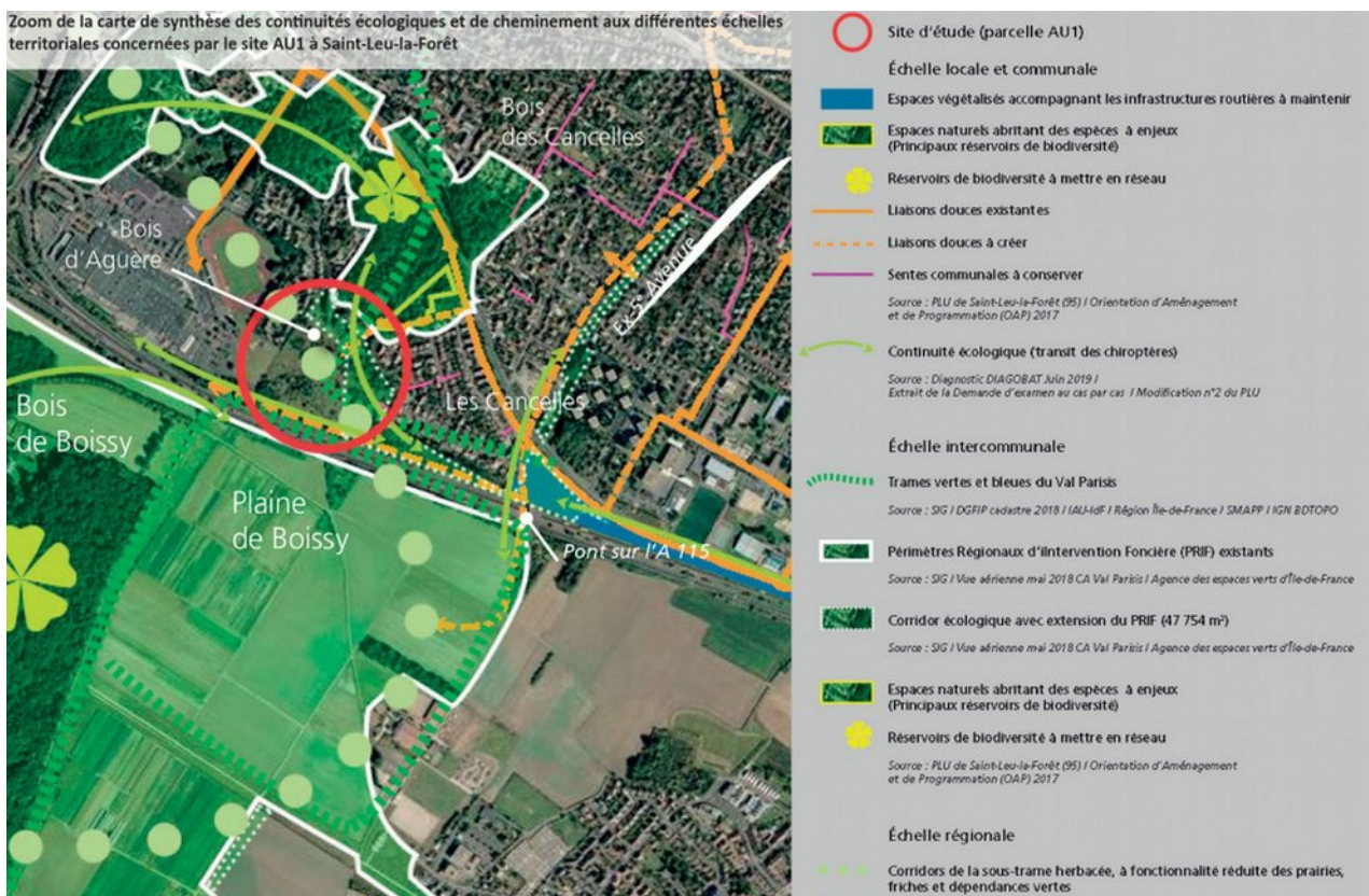
Illustration 6 : Continuités écologiques du secteur

À partir des enjeux et incidences identifiés dans l'évaluation environnementale, l'étude dite « Loi Barnier » fixe des principes visant à assurer l'insertion écologique, des aménagements. Ces principes sont repris dans l'OAP « Axe traversant est-ouest boulevard André Brémont », à travers des dispositions spécifiques au « secteur sud ouest non aménagé », rappelées ci avant.